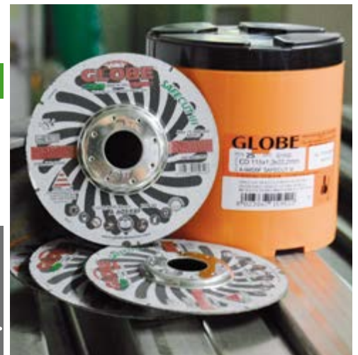
Esclusiva confezione in plastica da 25 dischi. Exclusive plastic packaging of 25 discs.