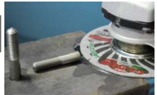
Taglio raso di prigionieri. Flush cutting of stud bolts.