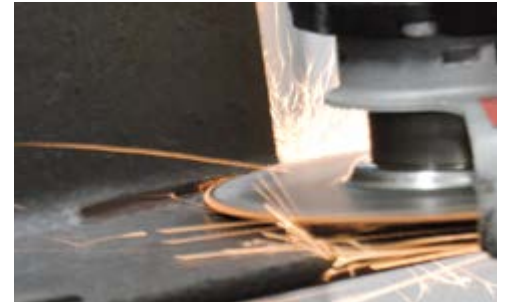
Taglio raso di profilo ad "H" in acciaio. Flush cutting of H-shaped steel sections.

Deeper penetration and greater cutting diameter of SAFECUT III with "narrow dome" than traditional DC wheels.